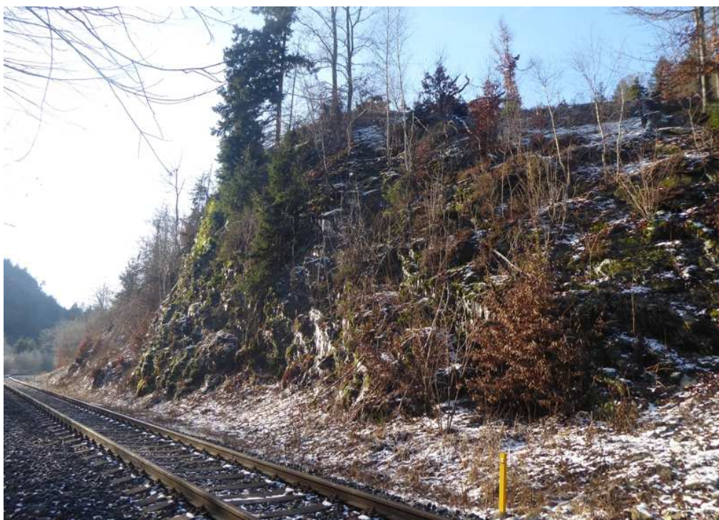
Pohled z konce úseku. Po odstranění vegetace, očištění skal. svahu a odtěžení akumulčního prostoru, bude v patě svahu v geotechnikem vytypované linii instalován ochranný plot v. do 2 m. Stávající vedení IS bude zachováno.