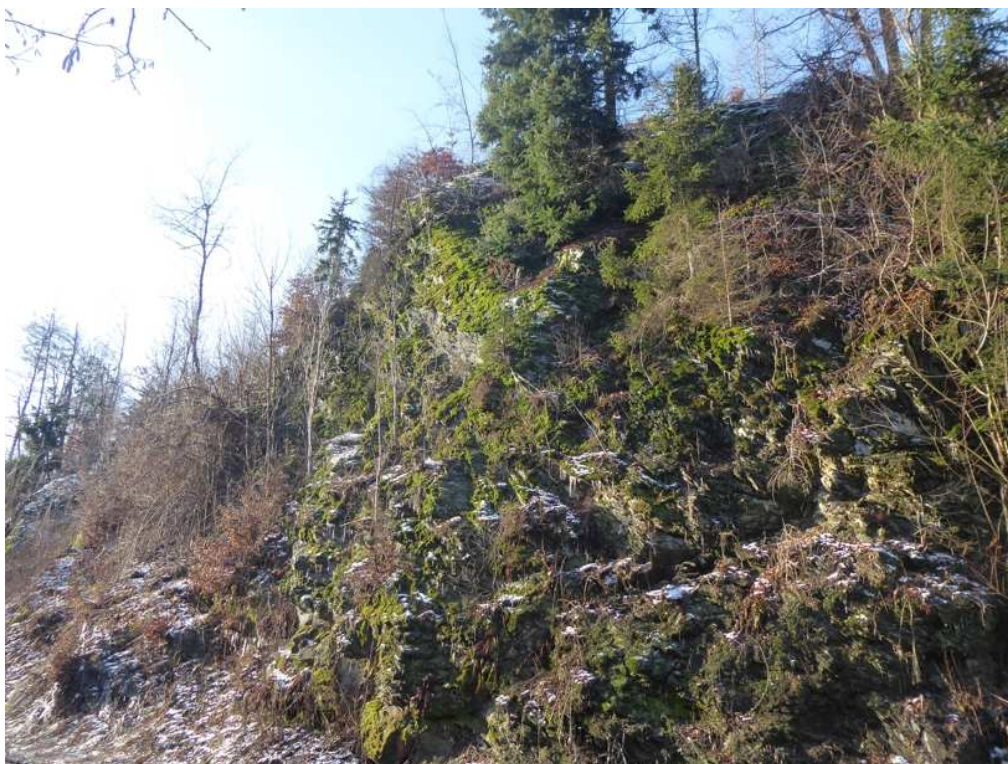
Po odstranění vegetace, odtěžení a očištění skal. svahu bude zajištěn ocel. sítí 80 x 100 mm, částečně doplněnou o protierozní extrudovanou georohož.